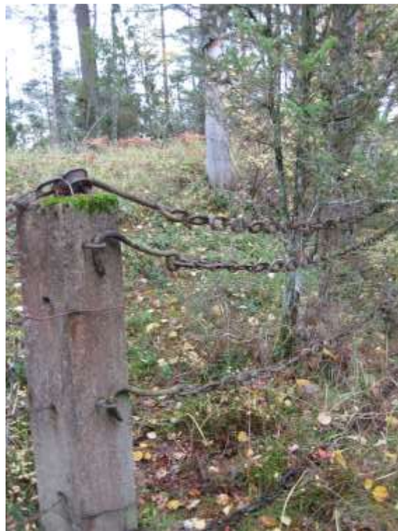
Den planerade gravgården i Simonby