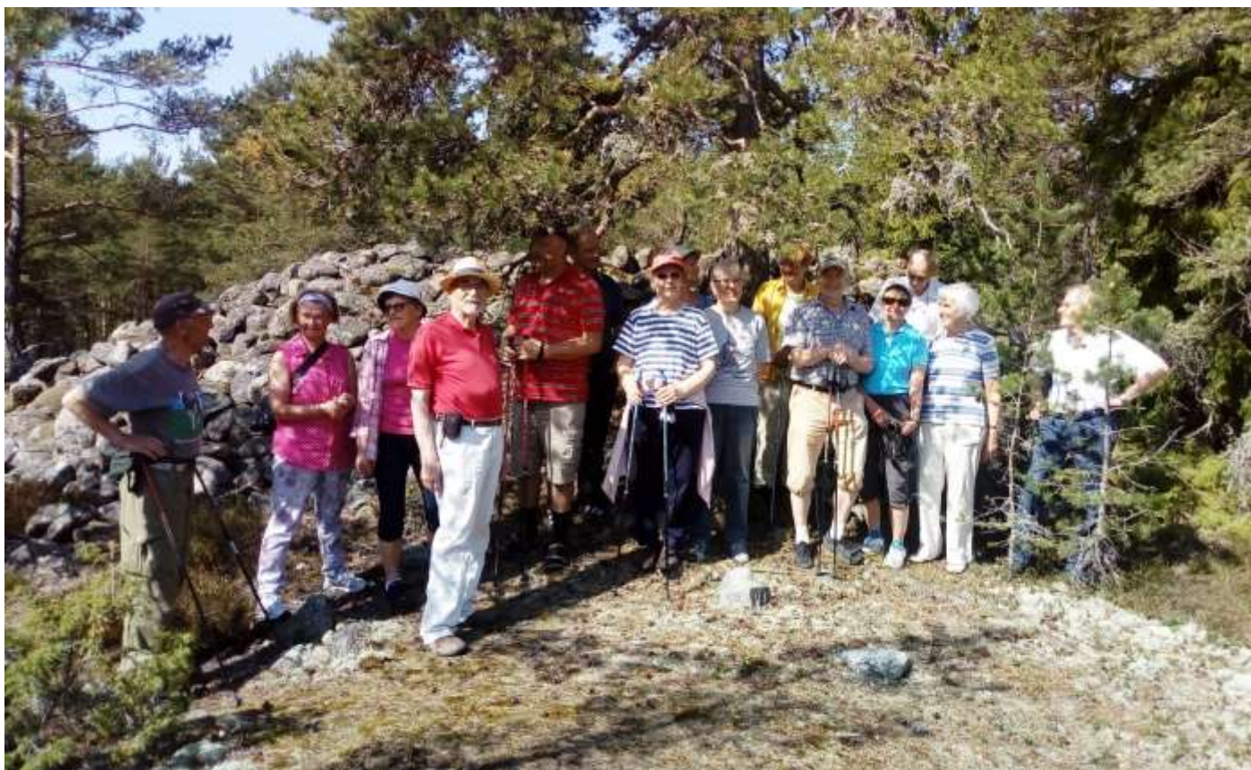
Stavgångarna vid bronsåldergrav i Sildala