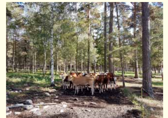
många ungdjur. En utvidgning till det dubbla planeras vara färdig om ett år. Efter 4,5h antrade vi Viken för retur till Granvik. Tack för ännu en minnesvärd vandring!