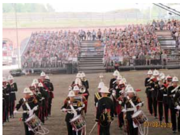
The Band of Her Majesty's Royal Marines.