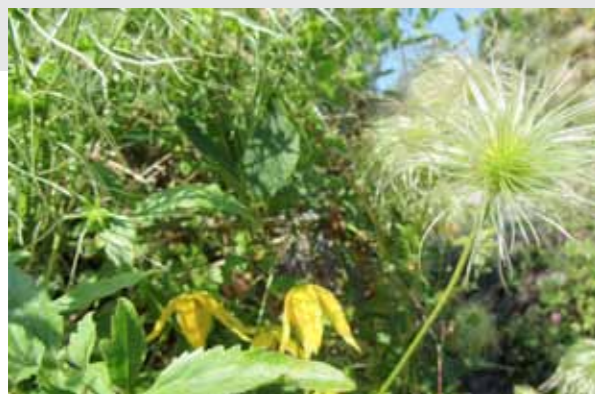
Klematis i Borgå!