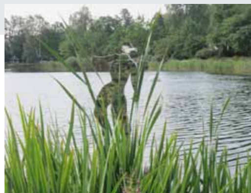
Sapokka park i Kotka.