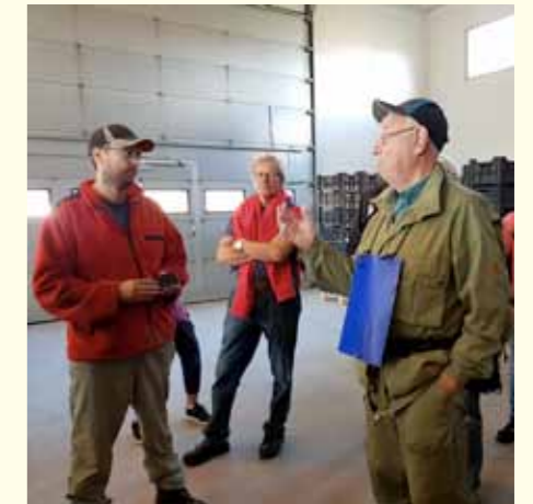
generationen, presenterade sina odlingar: 14ha på Heisala och 8 ha i Källvik. Äpplena förvaras i en hall där syrehalten tas ner till 1%! Mårdhundarna är ett större problem än rådjur o hjortar. De gräver sig in under stängslan och sedan