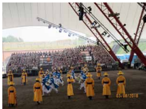
Republic of Korea Ministry of National Defence's Traditional Band.