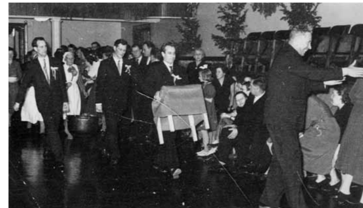
1950-tal PKAB:s julfest i Föreningshuset. Grötgrytan bärs in!