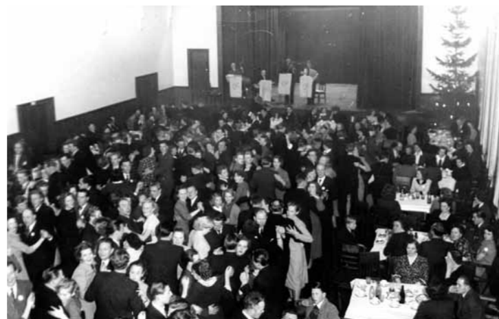
1950. Köpmannajulfesten i Föreningshuset.