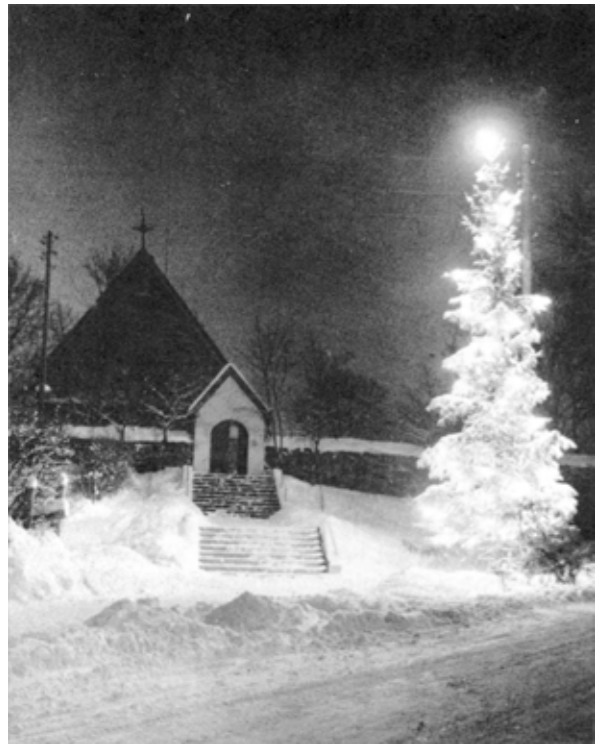
24.12.1949 Julgranen invivid kyrkrapporna.