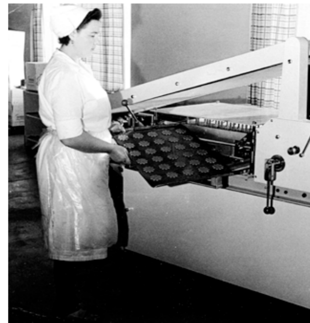
Här en bild av då man gräddar pepparkakor i Södermans bageri i Ersby