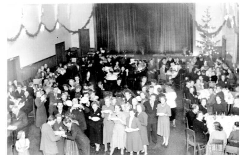
16.12.1949 Köpmännens grötfest i Föreningshuset.