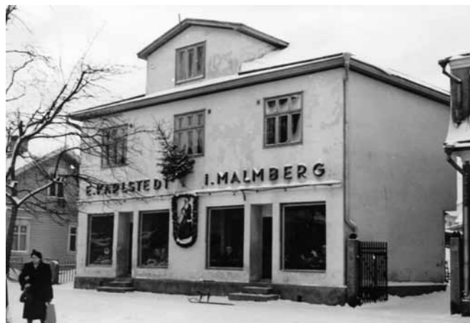
1942. Karlstedts mataffär och Malmbergs skoaffär.