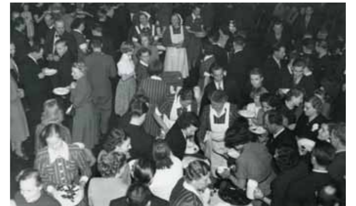
1950-tal. Personalfest troligen på PKABs huvudkontor.