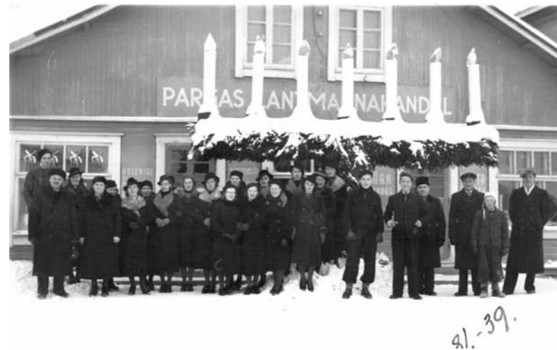
08.01.1939. Wilhelm Bäcklunds Pargas Lantmannahandel.