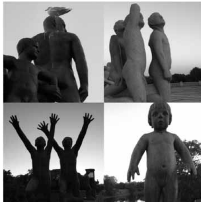
Kommunen är till för alla, både stora och små!.

Sammanställt av Kristina von Weissenberg